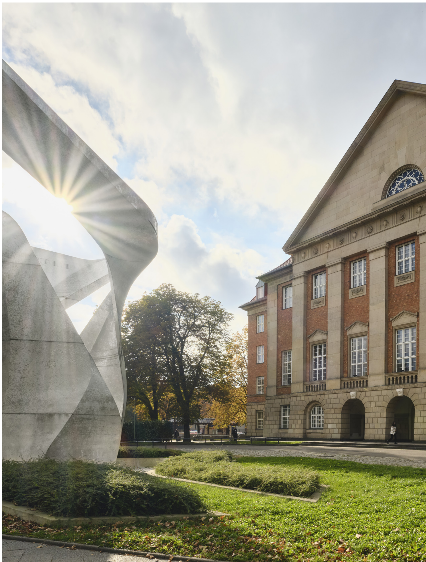
Blick auf das SIEMENS-Verwaltungsgebäude