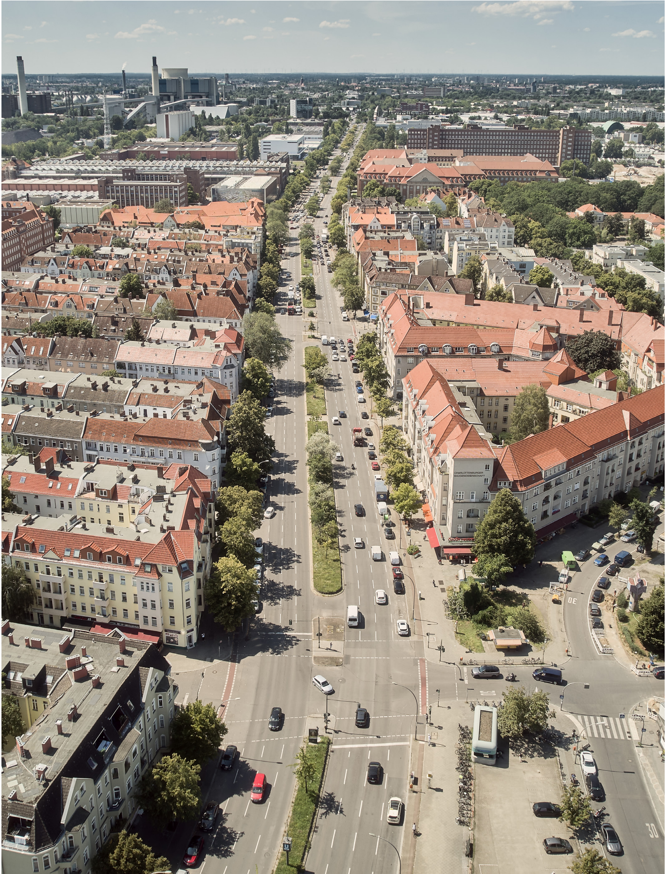
Blick auf die Nonnendammallee