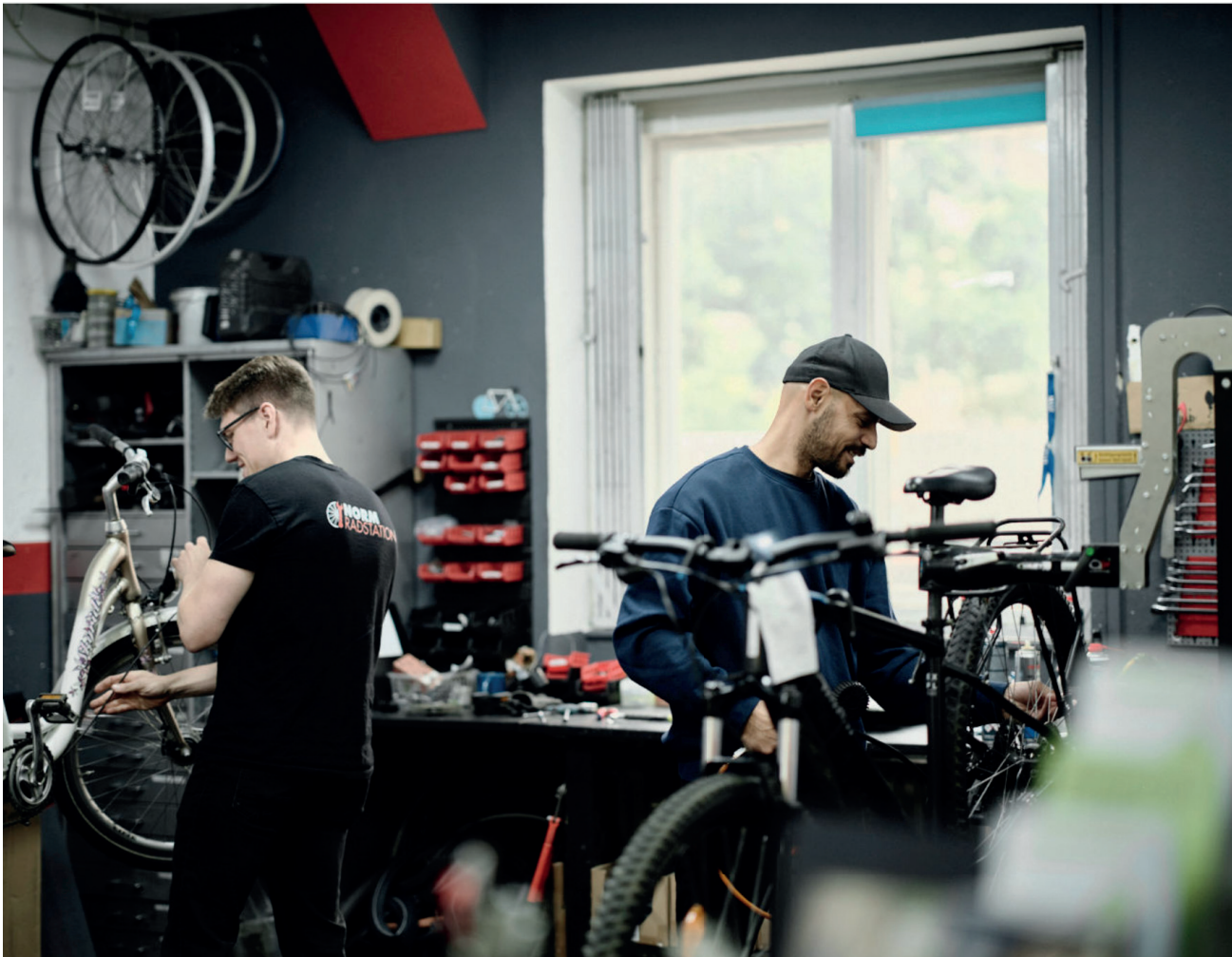
Blick in die Werkstatt, Norm Radstation