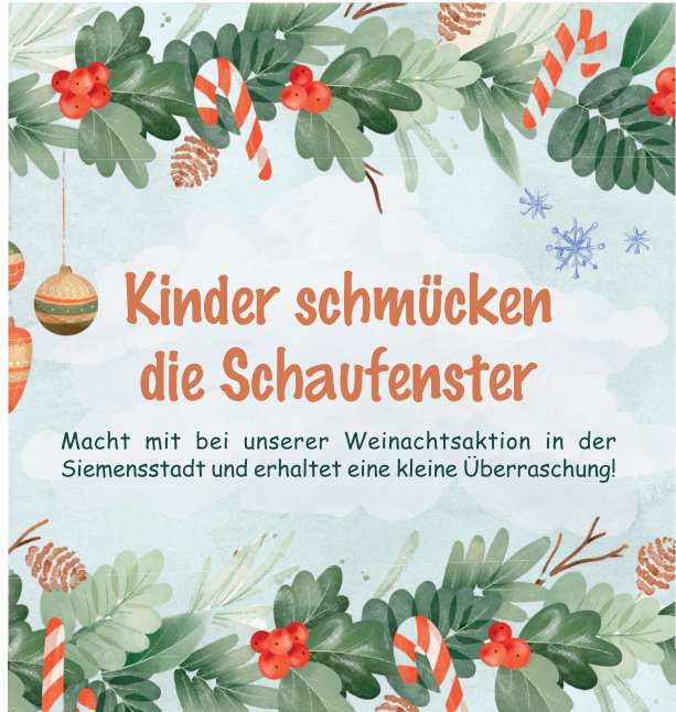
Flyer zur Bewerbung der Aktion

Nach erfolgreicher Durchführung im vergangenen Jahr findet in Kooperation mit dem Familienzentrum Rohrdamm in der diesjährigen Adventszeit erneut eine Weihnachtsaktion im Zentrum Siemensstadt statt. Diese richtet sich an alle Siemensstädter Kinder bis zu 10 Jahren. Sie sind herzlich eingeladen, gemeinsam mit Ihren Kindern eigenen Weihnachtsschmuck zu basteln und diesen an einem Samstag im Dezember in einem der teilnehmenden Geschäfte abzugeben (zu den regulären Öffnungszeiten). Die Geschäfte verwenden den Schmuck, um ihre Schaufenster zu dekorieren. Als Dankeschön erhalten Ihre Kinder ein kleines Weihnachtsgeschenk.