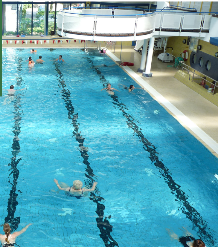
Schwimmhalle im Sportzentrum