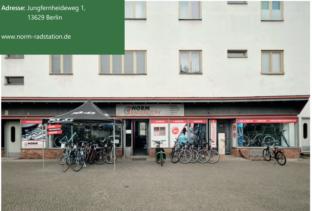
Außenansicht Norm Radstation

Ob neue Fahrräder und Zubehör, der umfassende Reparaturservice oder der Fahrradverleih – die Norm Radstation bietet alles rund ums Fahrrad. Besonders gefragt sind die Wartungen für die Firmenflotten von Unternehmen, die auf die präzise und zuverlässige Arbeit setzen. Auch wenn der Platz für Lastenräder aktuell fehlt, steht dafür vor dem Laden genügend Fläche für Probefahrten zur Verfügung, was besonders bei der Auswahl eines neuen Fahrrads von Vorteil ist.