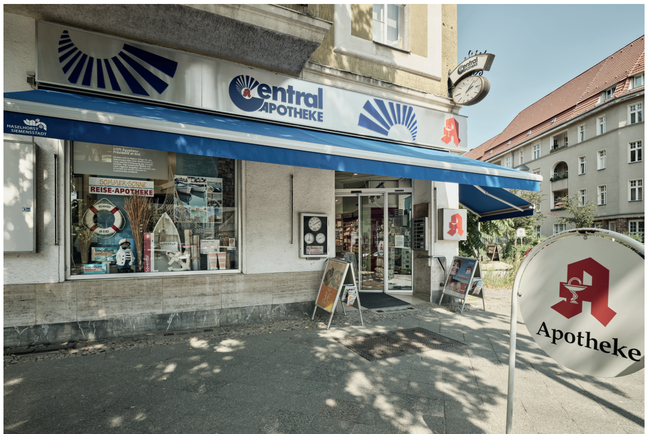
Umgesetzte Markise an der Central Apotheke