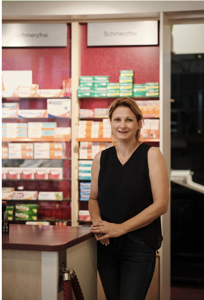
Inhaberin der Central Apotheke

Das elfköpfige Team der Central-Apotheke Siemensstadt ist multikulturell aufgestellt – das familiäre Arbeitsumfeld macht sich auch bei der Kundschaft bemerkbar. Beraten werden kann auf sechs unterschiedlichen Sprachen: neben Deutsch auch in Englisch, Arabisch, Türkisch, Polnisch und Russisch. Die Beratungsschwerpunkte sind Mutter-Kind – insbesondere die Betreuung von Frühgeborenen – Diabetikern, Senioren, Substitutions- und Schmerzpatienten sowie zu medizinischen Hautproblemen. Unterstützt wird das Team von einer vollautomatischen Medikamentenkommissionierer mit Greifarm von der Firma Gollmann, der vom