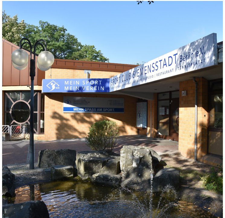
Blick auf das Sportzentrum

Unter dem Motto „Sport für Alle“ bietet der SC Siemensstadt Vereinssport in 18 Abteilungen, über 180 verschiedene Fitness- und Gesundheitskurse pro Woche sowie Rehasport, Kinderbetreuung und vieles Mehr an. Idee hinter dem Modell ist es, auch Nichtmitgliedern in einem Sportverein umfangreiche freizeitsportliche Aktivitäten anzubieten. Von Ballsportarten wie Tennis und Hockey über Tanzen und Yoga bis hin zu Turnen, Kampfsport und Leichtathletik ist für jeden Geschmack etwas dabei. Sogar Schwimmkurse und Aquafitness werden in der hauseigenen Schwimmhalle angeboten. Auch die ganz Kleinen können bereits beim Babyschwimmen oder Eltern-Kind-Turnen aktiv werden. Für jedes Kind (zwischen 3 und 5 Jahre), das noch nicht weiß, welche Sportart ihm gefällt, ist das SPATZ-Programm gedacht: Kinder dürfen gegen eine geringe Gebühr von Montag bis Freitag das SPATZ-Training mit unterschiedlichen Schwerpunkten besuchen und können so ihre Lieblingssportart entdecken und sich jederzeit für eine Mitgliedschaft entscheiden. Je nach Sportangebot kostet eine Mitgliedschaft durchschnittlich 20 bis 25 Euro pro Monat.