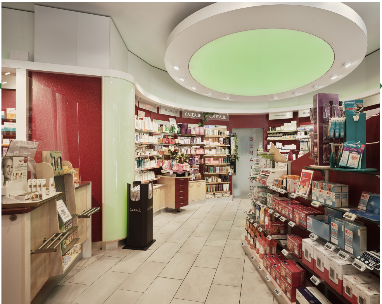
Central Apotheke Innenansicht